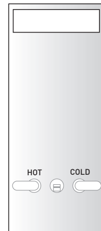
vista frontale / frontal view